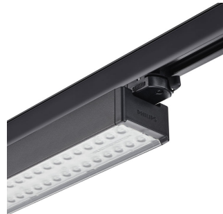
StoreSet Linear close-up track adaptor + endcap, black