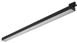
StoreSet Linear full length, black