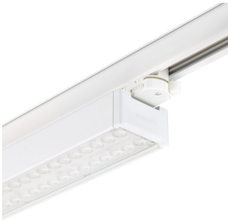
StoreSet Linear close-up track adaptor + endcap, white