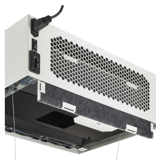
Dust filter fixation