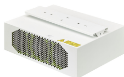
Fixation to ceiling or wall