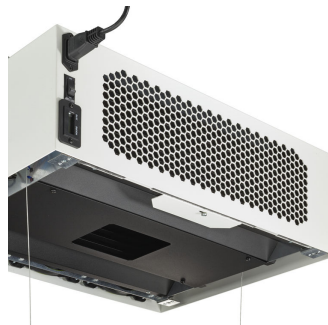
Inside the UV-C Active air unit