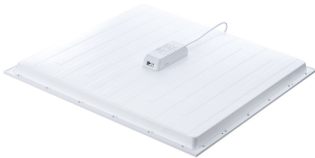
Ledinaire Panel 4100lm backside